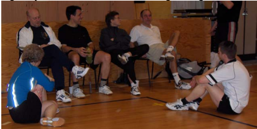
Nogle af deltagerne i klubturneringen - taktikken lægges!

Klubturneringen i år blev afviklet i en weekend, hvilket blev besluttet på sidste års medlemsmøde. Desværre var nogle stykker forhindret af forskellige årsager, men turneringen blev afviklet, og vi havde alle en rigtig hyggelig dag med mange gode kampe og ikke mindst det sociale blev dyrket, hvilket jo er grundlaget for enhver klubs eksistens. Vi startede med lidt morgenmad inden det for alvor gik i gang.